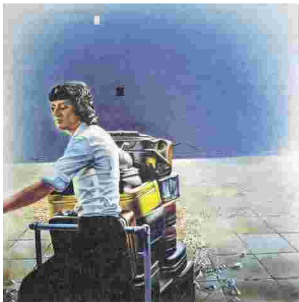
33. Näete maali “Kreeka motiiv” (1976). Kes on kunstnik?