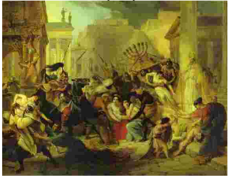
Genserichi sissetung Roomasse